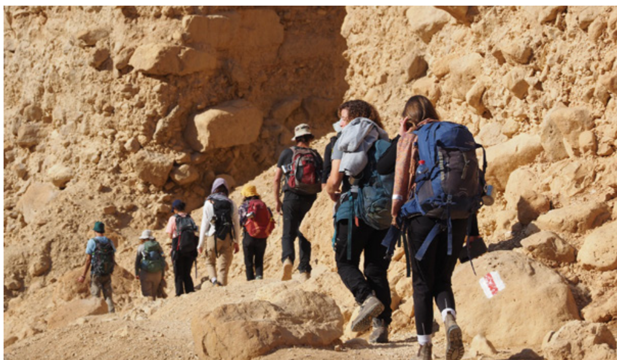
מסעות חוסן לבני נוער

מסעות החוסן "אדם-טבע-אדם" ממשיכים במלא המרץ, ומגדילים את היקף ההשפעה. מסעות אדם-טבע-אדם הם מסעות חוסן לבני נוער המשלבים הרפתקה בטבע, טיולים, התנסויות ומיומנויות שטח שונות, אתגרים ובחירה... וכל זה בקבוצות קטנות עם יחס חניכה אישי. דרך השהות בטבע וההתנסות המשותפת, המסעות מחזקים חוסן אישי וחברתי ומעמיקים את ההבנה של הקשר ההדדי בין האדם לטבע – טבע שומר אדם, ואדם שומר טבע. בשנה האחרונה השתתפו למעלה מ-250 בני ובנות נוער תושבי קו העימות ועוטף ישראל במסעות בהר הנגב, מדבר יהודה, בגליל ובכרמל. פרוייקט זה מסובסד ברובו על ידי תרומות רבות מהציבור הרחב, תורמים פרטיים והפדרציה היהודית ליהודי צפון אמריקה. מלווה בהערכה ומדידה בעזרת מכון ירושלים, ותוצאותיו בין היתר: 72% מהמשתתפים מעוניינים לצאת לטבע פעם נוספת במסגרת כזו או דומה, 92% מההורים דיווחו על כך שההשתתפות במסע סייעה לילדיהם בהתמודדות עם קשיים ואתגרים במהלך היום יום, 77% מהמורים ומהמלווים החינוכיים דיווחו כי המסע סיפק לכיתתם תחושת מסוגלות וכן הפחית תחושת מתח וחרדה.