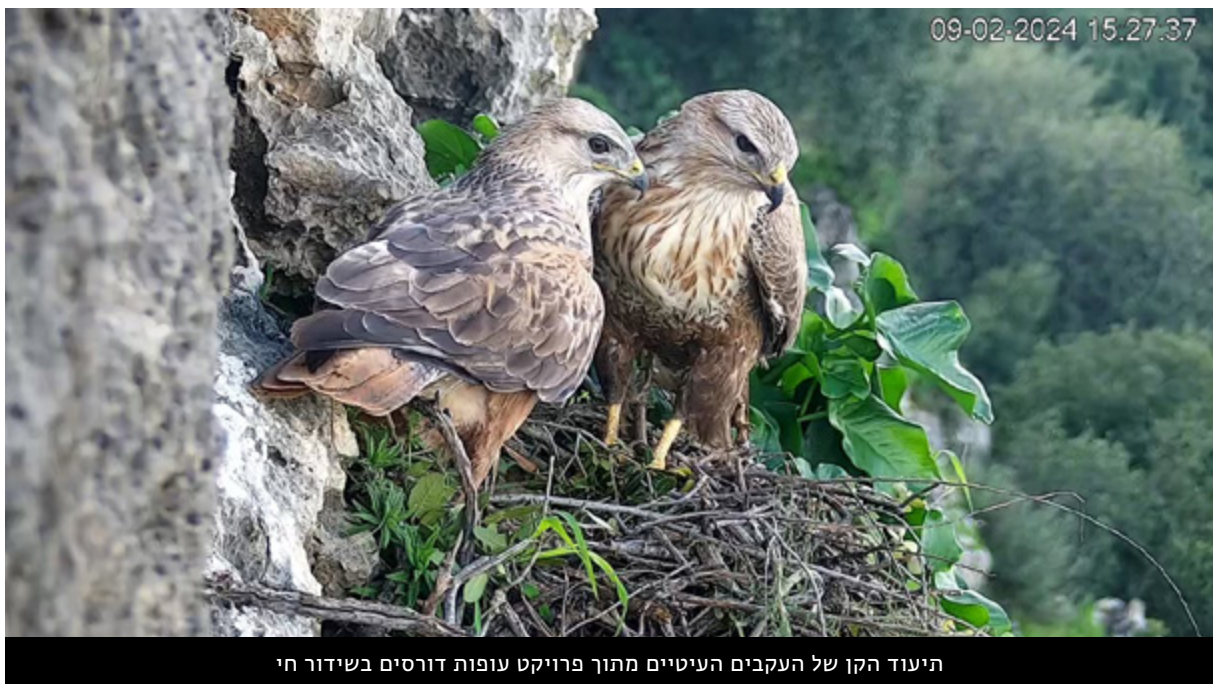
תיעוד הקן של העקבים העיטיים מתוך פרויקט עופות דורסים בשידור חי

פרוייקט ייחודי זה מתקיים בשותפות עם רשות הטבע והגנים זו השנה העשירית, ומשודר בשידור חי באתר הצפרות הישראלי. בשנת 2025 התקיים מעקב מצלמות אחרי זוג העקבים העיטיים, שלמרבה הצער נכשלו בקינון לראשונה לאחר תשע שנים מוצלחות; זוג החיוויאים הצליחו להפריח גוזל מול המצלמות; שישה זוגות של נשרים, וכן זוג רחמים, קיננו במרץ מול המצלמות בנגב, והפריחו חמישה גוזלי נשר ועוד שני רחמים. מול המצלמות התחוללו דרמות רבות, שמשכו מיליוני צופים בשידור החי ובסיכומים ברשתות החברתיות, מהארץ ומהעולם.