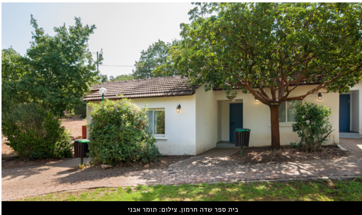
בית ספר שדה חרמון.

נקודת המפנה – אפריל 2025: חזרתם של בתי ספר שדה בצפון לפעילות מלאה בחודש אפריל, היוותה אבן דרך אסטרטגית. פתיחה זו סימנה את השבת הביטחון התיירותי ואת היכולת להחזיר למסלולם את מערך הלינות והטיולים באזורי קו העימות לשעבר. עם פתיחת הצפון, ראינו התאוששות מהירה בביקושים, הן במגזר החינוכי והן בקרב משפחות, שחיפשו את המרחבים הירוקים כחלק מתהליך הריפוי הלאומי. תחום בתי ספר שדה חתם את השנה האחרונה בעשייה רחבה, התחדשות והעמקת ההשפעה החינוכית בשטח. במהלך השנה מולאו שורות התחום באנשי ונשות סביבה וחינוך איכותיים, עם כניסתם של שני מנהלים חדשים לבתי ספר שדה גולן ועין גדי, הצטרפות רכזים ומדריכים בוגרים חדשים, והובלה של צוותים צעירים משובחים שממשיכים להפוך חזון חינוכי למציאות יומיומית.