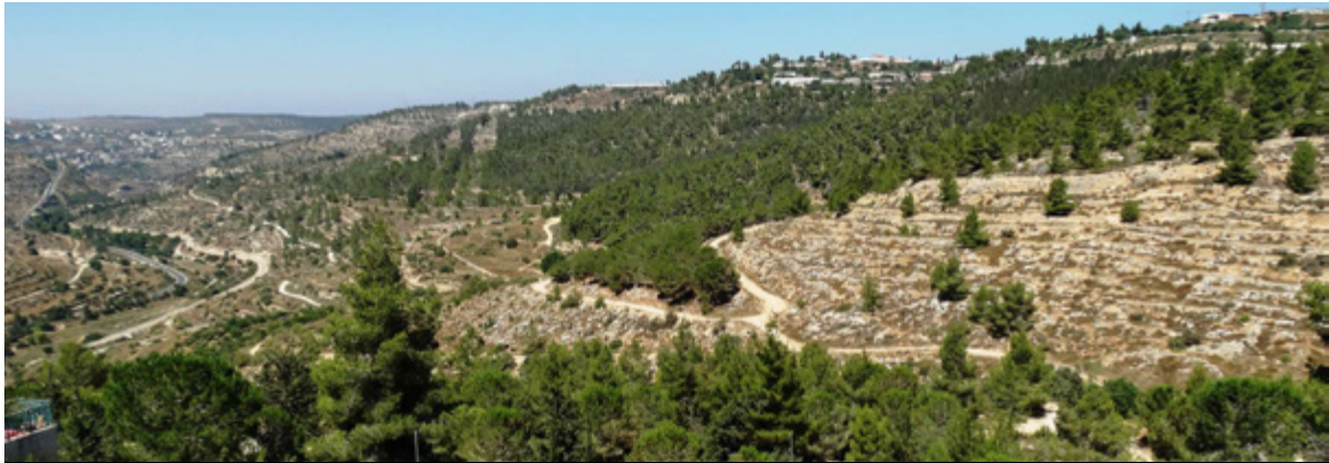
רכס לבן.

קידום תכנית מתאר ארצית 75 לפינוי מפרץ חיפה, כאשר במרכזה תכנון מחדש של מפרץ חיפה והיערכות משק האנרגיה להפסקת פעילות התעשייה הפטרוכימית במפרץ חיפה. תוכנית "שער המפרץ" היא תוכנית מתאר ארצית שמשמשת מסגרת לתוכנית ההתחדשות מפרץ חיפה. היא קובעת את ייעודי הקרקע, את מערך השטחים הפתוחים ואת מערך התשתיות בתוכנית החדשה, וקובעת הוראות והנחיות להכנת תוכניות מפורטות, כלומר - מייצרת את התשתית לקידום של התוכניות שמכוחן ניתן יהיה להוציא את התכנון לפועל.