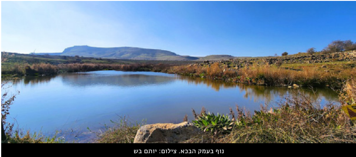
נוף בעמק הבכא.

עמק הבכא ברמת הגולן עומד בימים אלה במרכז מאבק ציבורי סביב סוגייה של שימור סביבת טבע מול פיתוח אנרגיה מתחדשת: המדינה מתכננת להקים בתחומו תחנת כוח סולארית רחבת היקף, שתופסת אלפי דונמים של שטח פתוח, תוך פגיעה בנוף, במרחב המחיה של חיות בר רבות, ובמורשת היסטורית חשובה של קרבות מלחמת יום כיפור. למקום יש ערכיות אקולוגית גבוהה במיוחד, והוא כולל גם מרחבים עשבוניים שמושכים מינים בסכנת הכחדה כמו הצבי הארץ-ישראלי. הקמת שדה סולארי קרקעי במקום כזה עלולה לגרום להרס ניכר של מרחבים טבעיים יקרים.