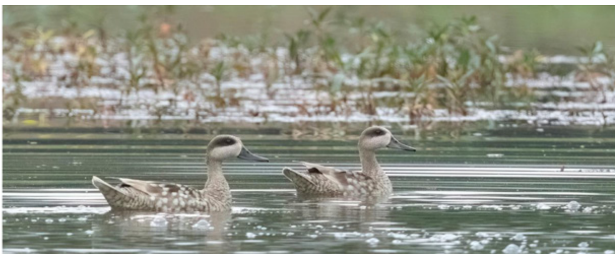
ברוזה משיש, מין נדיר התלוי בקיומם של בתי גידול לחים.

קיבלנו המשך תמיכה מ-Glazer foundation לקידום מדיניות שימור ושיקום בתי גידול בישראל. התמיכה, בסך 300 אלף דולר לשנת 2026 ולשנת 2027, תאפשר לנו להמשיך בעבודת המיפוי, בניית המתודולוגיה, ודחיפה של פתרונות לצורך קידום תחום השיקום בישראל. גם בימים אלה ממשיך קידום החלטות קול קורא מיוחד לנושא השיקום, דרך "קרן השטחים הפתוחים". הקול הקורא מתייחס בשנים אלה לפרויקטים בתחום שיקום בתי גידול לחים. אנחנו פותחים השנה מיזם משותף עם המשרד להגנת הסביבה, לקידום תכנית פעולה לתחום השיקום במדינת ישראל.