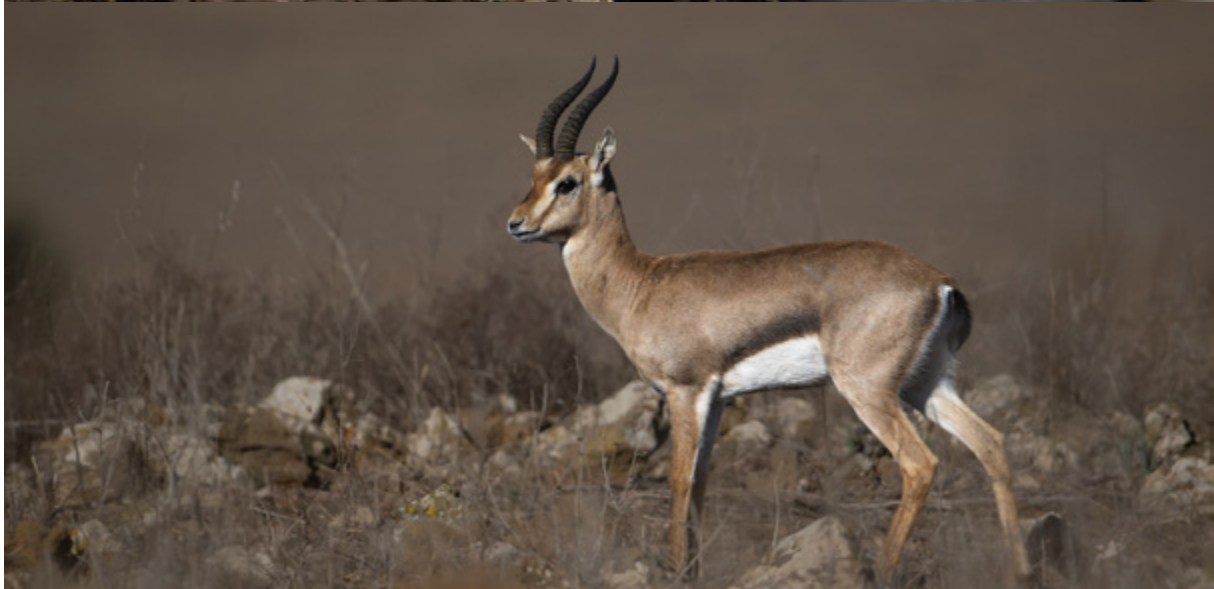
חתול בר וצבי ברמה הגולן.