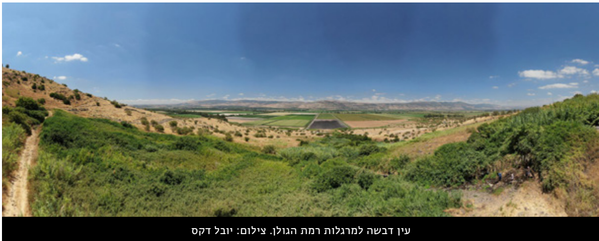
עין דבשה למרגלות רמת הגולן.

בעקבות פעילות שלנו במוסדות התכנון, קודם נושא המסדרונות האקולוגיים ברמה המחוזית וברמה הארצית, קודמה החלטת מועצה ארצית להכנה של תמ"א למסדרונות אקולוגיים ותוספת שטחים מוגנים. בימים אלו פועלת ועדת עורכים על תיקון 26 לתמ"א 1 - הכנה של תכנית סטטוטורית למסדרונות אקולוגיים, והחלק של מחוז דרום הופקד להערוך, עם תוספת משמעותית של שטחים מוגנים.