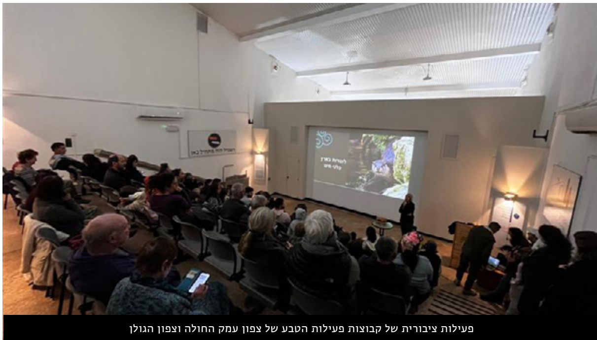
פעילות ציבורית של קבוצות פעילות הטבע של צפון עמק החולה וצפון הגולן

החברה להגנת הטבע החליטה להציב את הגולן ואת שיקום הצפון בראש מעייניה, מתוך הכרות עם אתגרי הפיתוח השונים במרחבים אלה, ומהחשיבות שאנו מייחסים לחיזוק הקהילות הצפוניות, שנפגעו במהלך המלחמה. לשם כך גוייס רכז פעילות ציבורי לרחב זה, הפועל בשיתוף כלל יחידות החברה במרחב, ועם גופי הסביבה והרשויות. במהלך השנה האחרונה הוקמו וחוזקו קבוצות פעילות בגולן ובעמק החולה. קבוצות אלה מקיימות פעילות סדירה של טיילות, ניקיון, הכרת השטח, והחלפת מידע שימושי לגבי המתרחש בטבע סביבם. מאות תושבים ותושבות פעילים בקבוצות אלה, מחזקים את הזיקה ואת חיבור הקהילות לשטח, ומהווים גרעין פעילות לשמירה על הטבע המקומי.