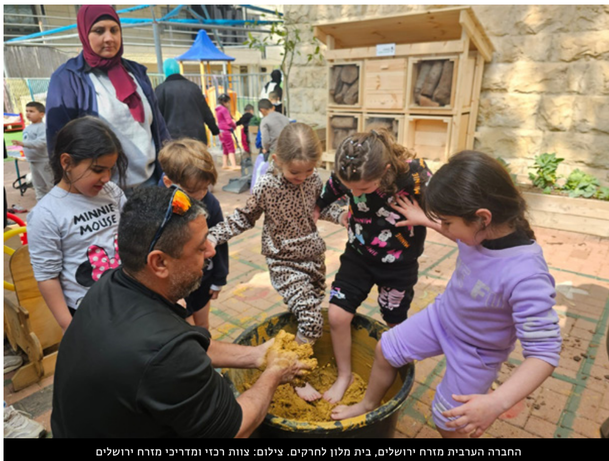
החברה הערבית מזרח ירושלים, בית מלון לחרקים.

במהלך השנה החולפת, התמקדה מחלקת החינוך במזרח ירושלים בביסוס והעמקת הקשר של ילדים ובני נוער עם הטבע העירוני. הדבר נעשה באמצעות גישה לימודית חווייתית, מחקרית ומשמעותית. הפעילות הורחבה באופן ניכר, פותחו תהליכים מעמיקים ומתמשכים עם מוסדות החינוך השונים, ואלפי תלמידים, גננות ומורים נחשפו לחוויות עשירות של טבע, חק, סקרנות והבנה סביבתית. שנה זו התאפיינה בצמיחה והתפתחות, ביוזמות חדשניות, בחיזוק ניכר של שיתופי הפעולה ובקידום תהליכים חינוכיים ארוכי טווח – כל זאת תוך הקפדה על התאמה תרבותית, קהילתית ופדגוגית מלאה לצרכים הייחודיים של התלמידים והמסגרות החינוכיות במזרח העיר.