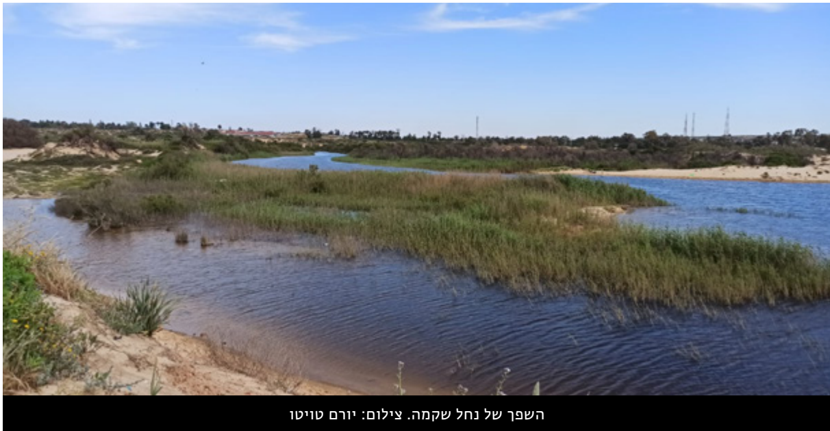
השפך של נחל שקמה.

ציר מרכזי בפעילות השנה היה ההתמודדות עם משבר הזיהום החמור בנחל שקמה, בעקבות קריסת מתקן הטיפול בשפכים במאי 2024, שהובילה לזרימה של כ-500 אלף קוב שפכים גולמיים, תעשייתיים ובייתיים, לנחל בנגב המערבי. בשיתוף ארגון התושבים המקומי "עתיד לעוטף" וארגונים סביבתיים נוספים, הובלנו קמפיין ציבורי, תקשורתי ופרלמנטרי אינטנסיבי, אשר הביא להפסקת הזיהום. מעבר לכך, נבנתה תשתית שותפויות רחבה שמאפשרת כיום לקדם תהליך שיקום לנחל, מתוך ראייה ארוכת טווח של שיקום סביבתי וחברתי כאחד.