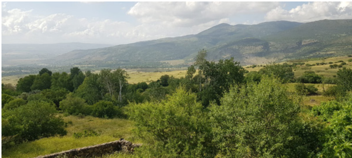
נוף עין פית

צה"ל קידם במרחב עין פית בצפון רמת הגולן תוכנית פיתוח, שכללה הקמה של מתקן אימונים ללוחמה בשטח בנוי, ולמעשה - בסיס אימונים צבאי רחב היקף, שיכלול מבנים וסימולציות של מרחב עירוני, לצורך אימון הכוחות. התוכנית קודמה דרך הוועדה למתקנים ביטחוניים (ולמ"ב), מנגנון תכנון ייעודי לפרויקטים ביטחוניים שמאפשר אישור מהיר, ללא הליך תכנוני רגיל, ללא דיון ציבורי וללא שקיפות מלאה, דבר שעורר ביקורת חריפה מצד פעילי סביבה ותושבי האזור. האתר עצמו, המעיין והעמק סביבו, מוגדרים כמרחב טבע אקולוגי ותרבותי נדיר, עם צמחייה עשירה, חיות בר וחשיבות כ"מסדרון אקולוגי" בין שמורות טבע בצפון הארץ. בתגובה לתוכנית זו החל מאבק ציבורי רחב היקף, אותו יזמו והובילו קבוצת תושבים ומטיילים, אליהם הצטרפו גם אנחנו וגם ארגוני סביבה נוספים. במסגרת הפעילויות למען המרחב, פעלנו הן בזירה הפרלמנטרית - דרך הגשת שאילתות, דיונים בכנסת וסיורים למקבלי ההחלטות, והן בזירה הציבורית - דרך תקשורת ופעילויות לציבור הרחב במקום. עתירה משפטית בנושא הוגשה על ידי אדם טבע ודין. המאבק עורר התעניינות ציבורית ערה, וכ-34,000 חתימות נאספו במסגרת עצומה, שהועלתה על ידי הפעילים. במהלך השנה נערכו דיונים בוועדת הפנים והגנת הסביבה, בראשות ח"כ יצחק קרווייזה, תושב הגולן, איתו סיירונו בשטח בשלב מוקדם יותר. במסגרת הדיונים הועלו הטענות כי התוכנית אושרה ללא תסקיר השפעה על הסביבה, ללא שיתוף הציבור, ומבלי שנבחנו חלופות ראויות - והודגש כי ההליך עלול לגרום לנזק סביבתי בלתי הפיך למעיין ולעמק הפראי.