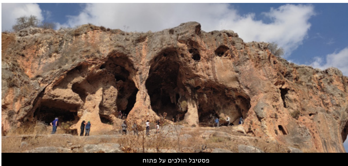
פסטיבל הולכים על פתוח