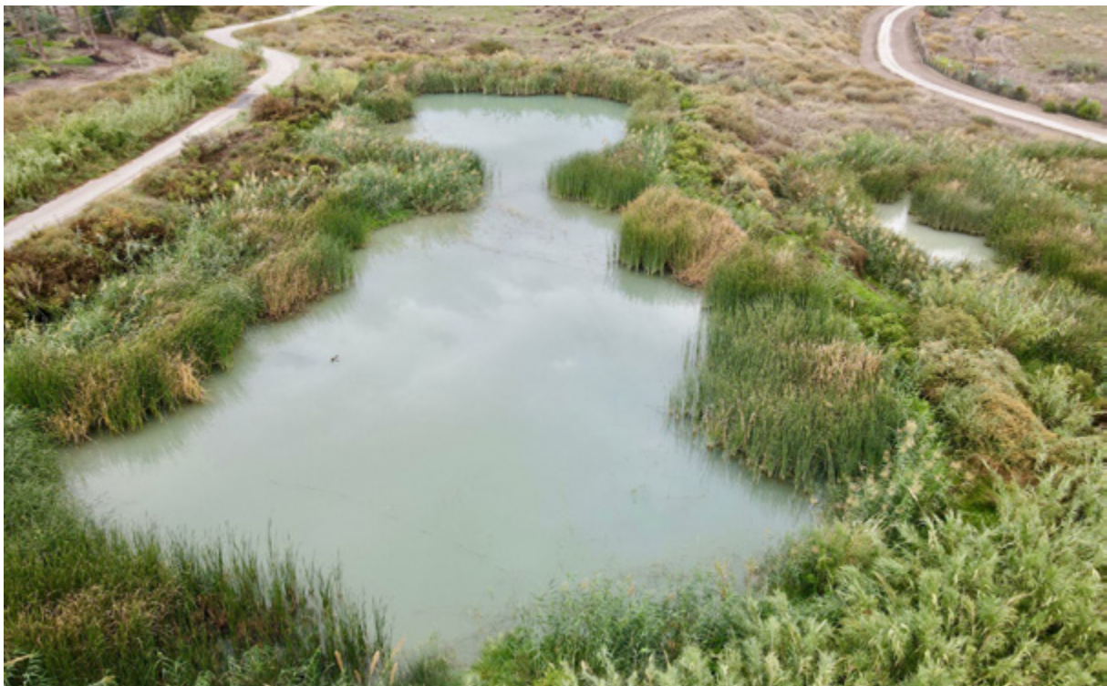
הבריכה המרכזית של פארק הצפרות בכפר רופין במבט מרחפן.

בעמק החולה , החל שיתוף פעולה עם הקיבוצים דן ודפנה, בשיתוף עם רשות הטבע והגנים, לשיקום חלק מבריכות הדגים הנטושות.