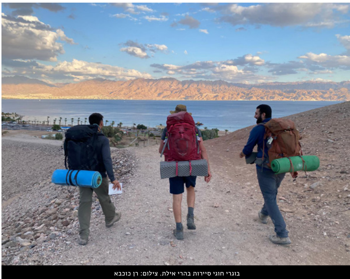
בוגרי חוגי סיירות בהרי אילת.