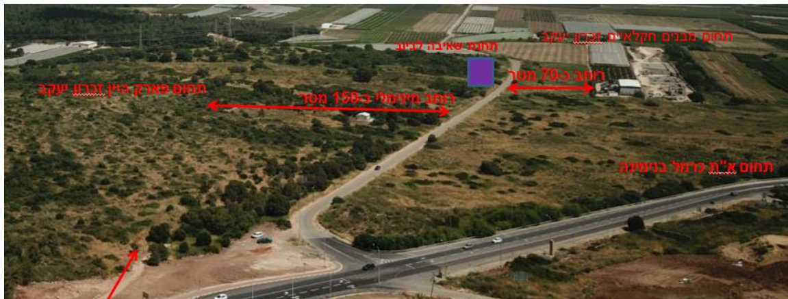
מעבר בע"ח תחתי מרמת הנדיב