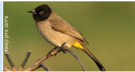
Bulbul בולבול בליל