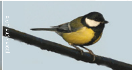
Great Tit ירגזי מצוי קרפף כביר