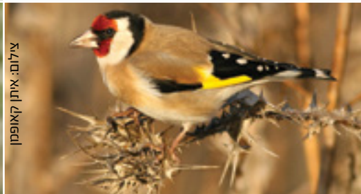
Goldfinch חוחית חסון