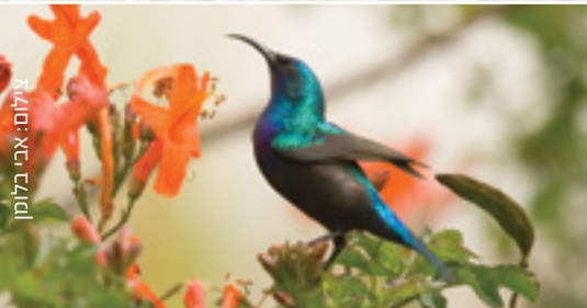
Palestine Sunbird צופית בוהקת אבו הזר