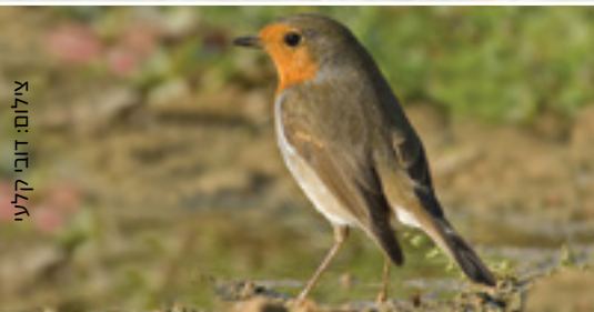
Robin אדום החזה אבו חנא