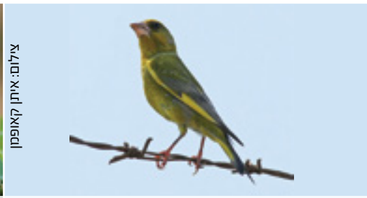
Greenfinch ירקון חסון אספר