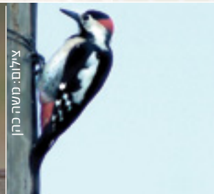
Syrian Woodpecker נקרסורי נקאר זחשב