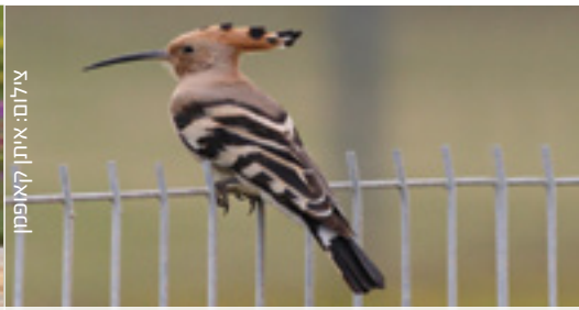
Hoopoe חוכיפת הדהד