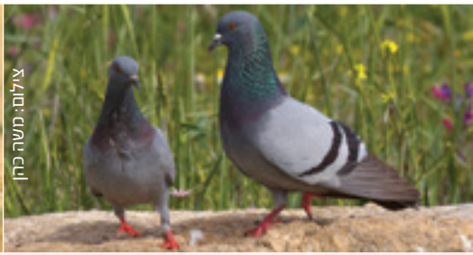
Feral Pigeon יונה חמאמ טוראני