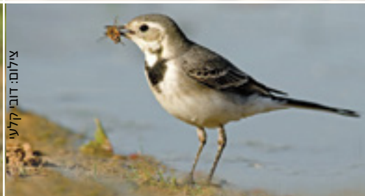
Pied Wagtail נחילאלי לבן כרקס