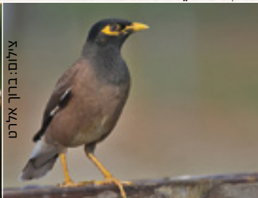
Common Myna מיינה מינה