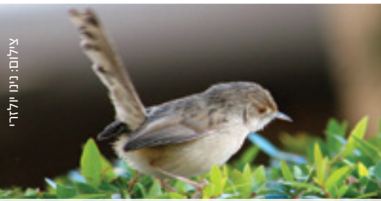
Graceful Prinia פשוט פסיסי