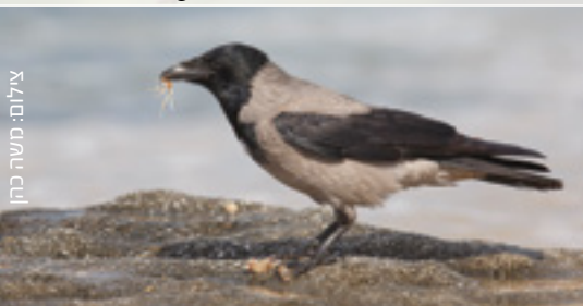
Hooded Crow עורב אפור גראב רמאדי