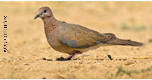
Laughing Dove צוצלת דבסייה זחכח