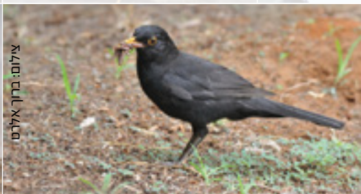
Blackbird שחרור שחרור