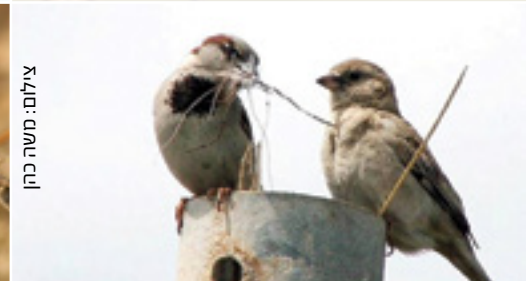
House Sparrow דרור הבית דורי הבית