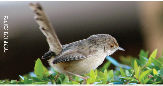
Graceful Prinia פשוט פסיסי