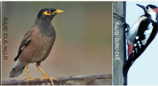
Common Myna מיינה מינה