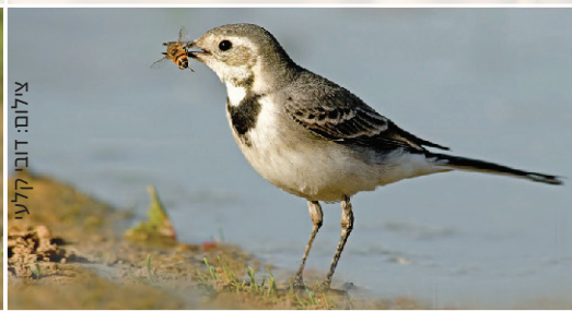
Pied Wagtail נחילאלי לבן כרקס