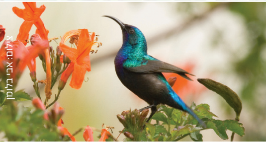
Palestine Sunbird צופית בוהקת ابو الزهر