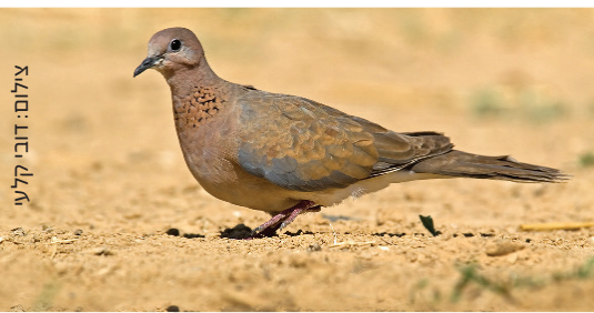
Laughing Dove צוצלת דבסיה ضاحكه