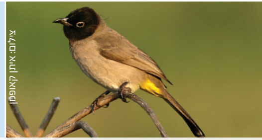
Bulbul בולבול بلبل