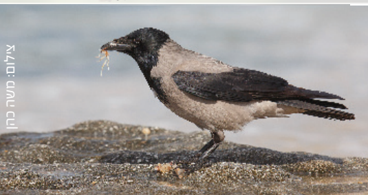
Hooded Crow עורב אפור غراب رمادي