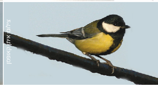
Great Tit ירגזי מצוי قرقف كبير