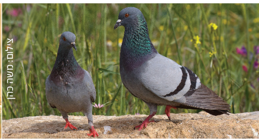
Feral Pigeon יונה حمام طורاني