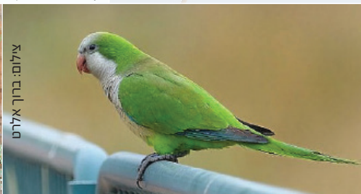
Monk Parakeet תוכי נזירي بيغاء الراهب