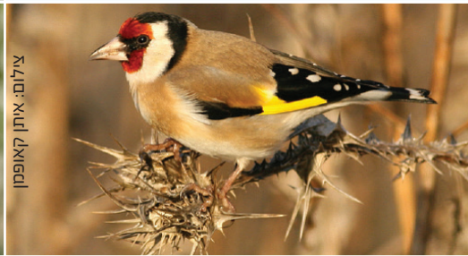
Goldfinch חוחית חסון