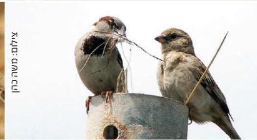
House Sparrow דרור הבית دوري البيت