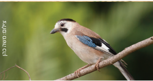
Jay עורבני שחור כיפה ابو זריק