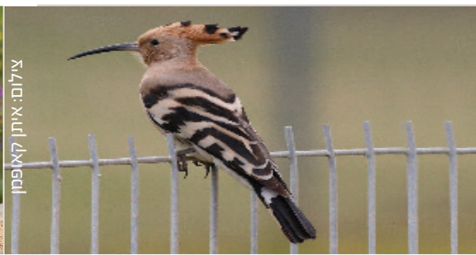
Hoopoe דוכיפת مهدד