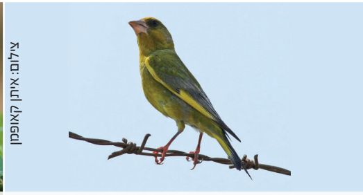
Greenfinch ירקון חסון أخضر