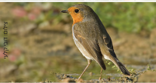
Robin אדום החזה أبو الحناء