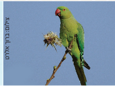
Rose-ringed Parakeet דררה דרה