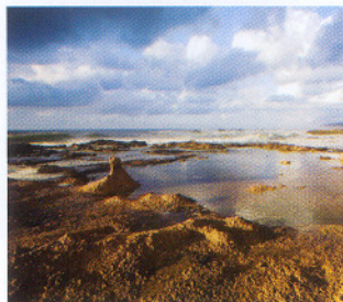
בשער: גן לאומי אכזיב